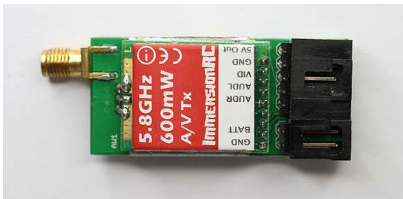
Abb. 1. Oberseite des ImmersionRC 600mW 5.8GHz Audio/VideoSenders.